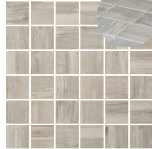
2003557 Penta Olden Matte